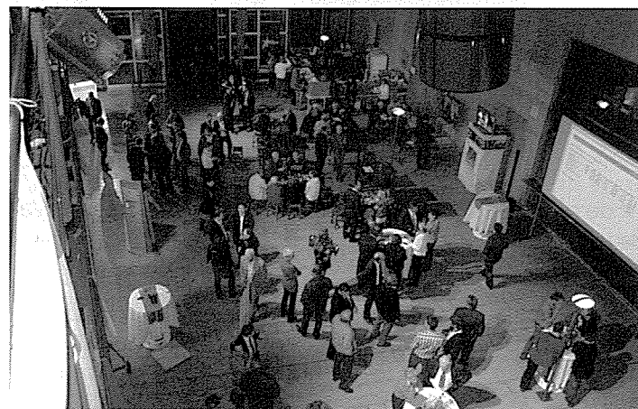
Le centre des médias à Sion en plein effervescence

Même si la distance avec la 2 e place a été réduite de plus de